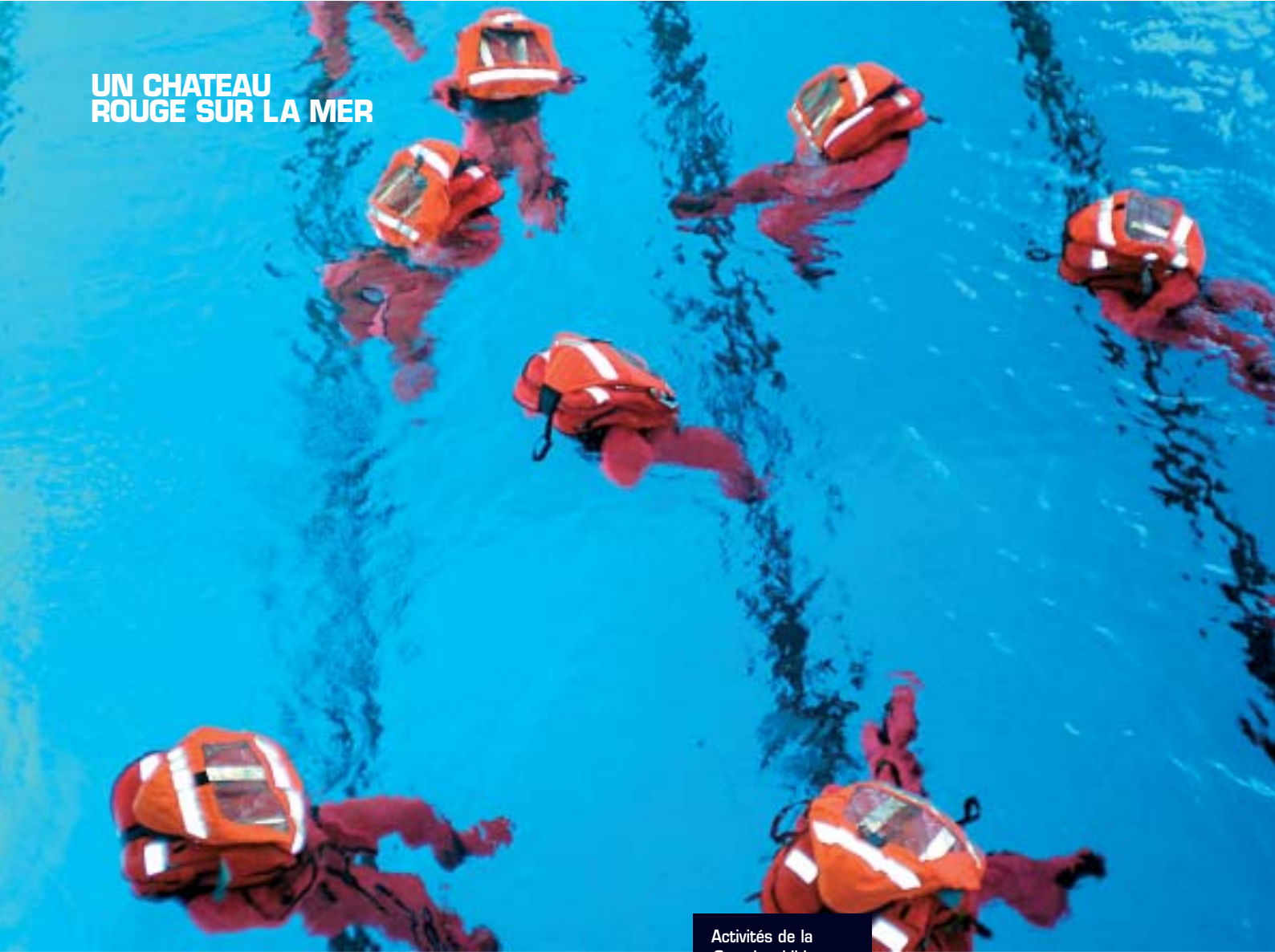
Activités de la Grundausbildung – formation de base : marche avec équipement de combat, stage de survie en mer.