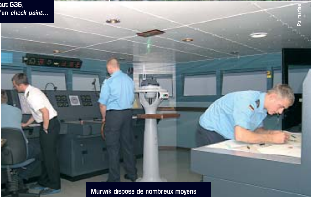
Mürwik dispose de nombreux moyens informatiques pour assurer la formation maritime des élèves.

autonome. Date de retrait des dossiers : 1 er décembre 2006 au 1 er mars 2007. Date limite de dépôt des dossiers : 1 er avril 2007. Tests et entretiens de présélection (Paris) : avril 2007. Tests et entretiens de sélection (Brest) : deuxième quinzaine de juin 2007. Incorporation dans la Marine nationale : première quinzaine de juillet 2007. Renseignements : service d'information sur les carrières de la Marine – section recrutement officiers – 15, rue de Laborde – BP 25 00300 Armées. Tél. : 01 53 42 87 30. www.marinerecrite.gouv.fr E-mail : efena@recrutement.marine.defense.gouv.fr